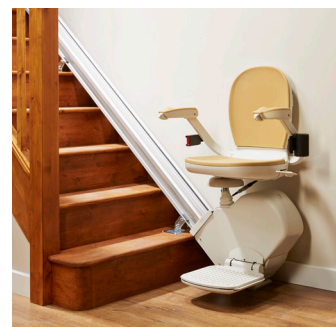
Für gerade Treppen