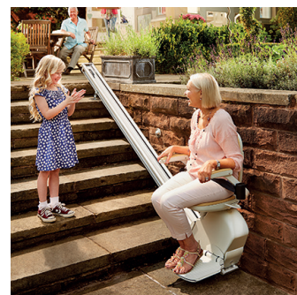
Für den Außenbereich

* Ihre Einwilligung können Sie jederzeit ohne Angaben von Gründen mit Wirkung für die Zukunft widerrufen. Bitte richten Sie Ihren Widerruf an Acorn Treppenlifte GmbH, Erkrather Straße 234b, 40233 Düsseldorf, partner@acornTreppenlifte.de Selbstverständlich haben Sie außerdem das Recht auf Auskunft über die übermittelten Daten sowie auf Berichtigung oder Löschung.